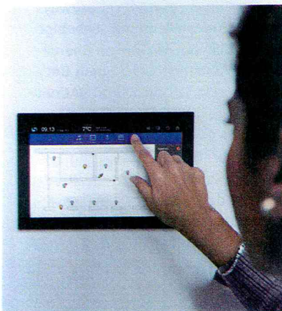
Neuster breiter AMX-Touchmonitor mit randbündiger Glasfront für Einbau und als elegante Tisch-Ständerversion, erlaubt gleichzeitig den Grundriss und ein Videotürbild darzustellen.

Schöne Taster, mit individuell parametrierbarer LED-Beleuchtung, sind selbstverständlich. Dabei lässt sich auch die Musik über Taster bedienen. Der Raumtemperaturfühler ist hinter den Tasten der Schalterelemente integriert. Es braucht da-