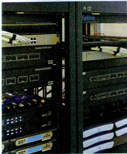
Auch komplexeste Servertechnik erhält der Elektroinstallateur fixfertig aufgebaut; er darf sich seinem Kerngeschäft widmen, der Verkabelung.

stellung. Selbstverständlich sind das Elektroschema und die Installationspläne, auf Wunsch sogar die ganzen Verteiler, fertig aufgebaut, die Racks mit Servern und Switches und alles übrige Material programmiert. Bei Projektfragen ist eine Person bei Spline von der Hard- bis zur Software zuständig und leistet gerne Unterstützung.